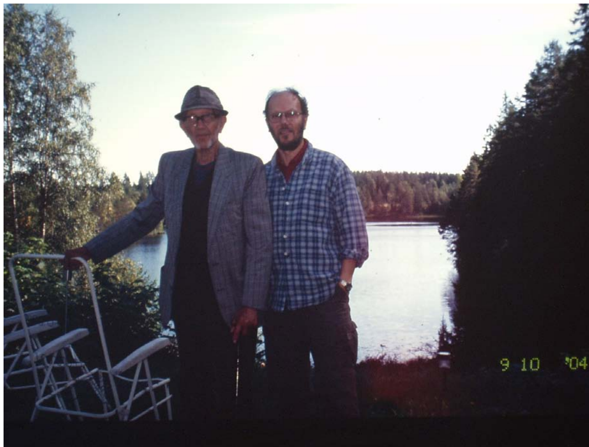
Farsan och jag med Mörtsjön i bakgrunden.