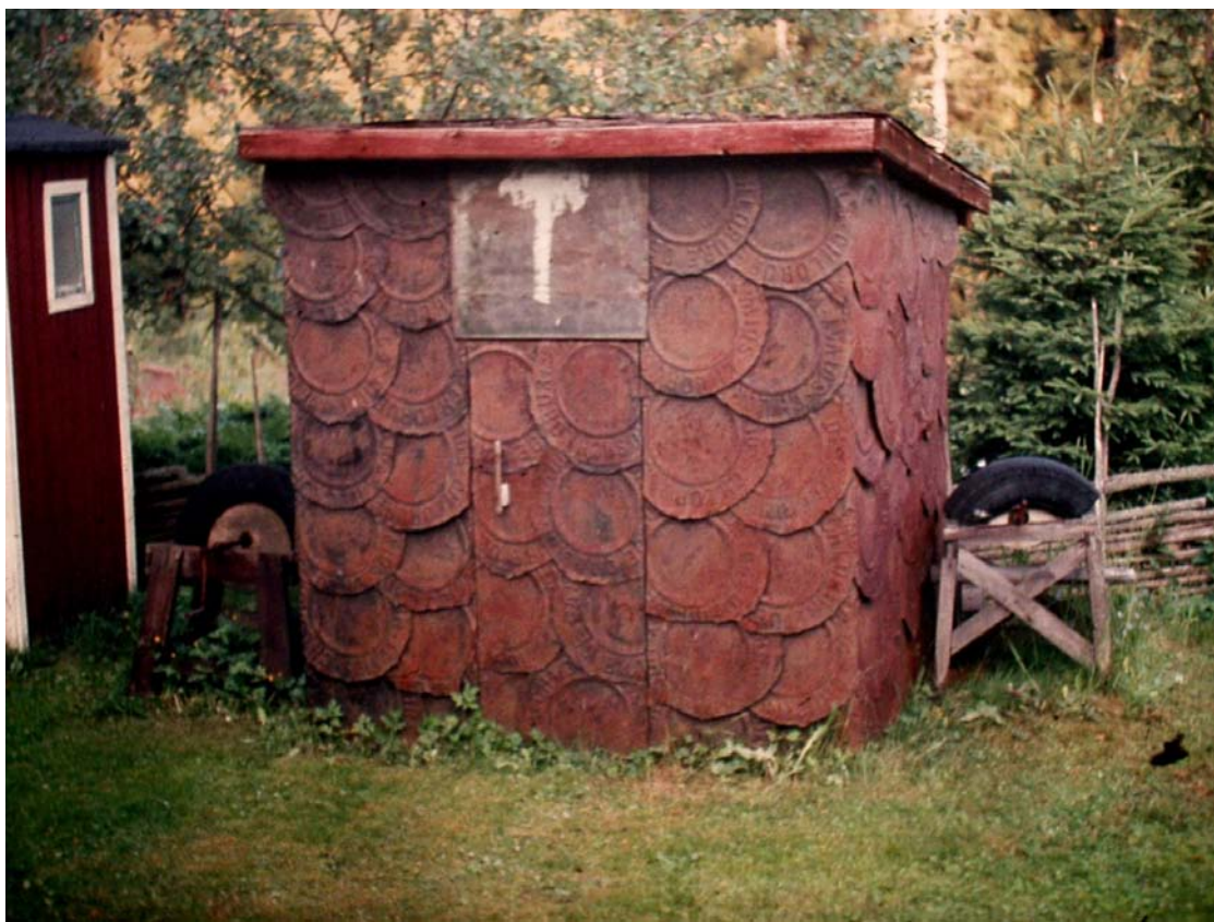
Uthuset Munter-Gustav byggde av locken från salttunnorna vid Morshyttans station