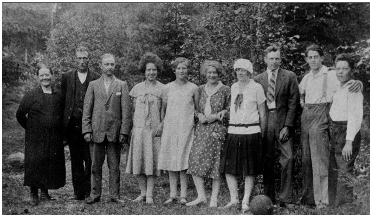
Familjen Bylén i Sjöänge, med vänner, 1930. Farsan längst till höger.

Widar blev inte gammal, han hade ju dålig hälsa redan från barndomen.